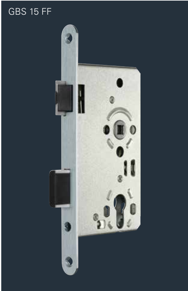
GBS 15 FF